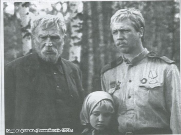
Кадр из фильма «Вечный зов», 1973 г.

В Белорецком районе к Краснополяскому и Ускову присоединился режис-