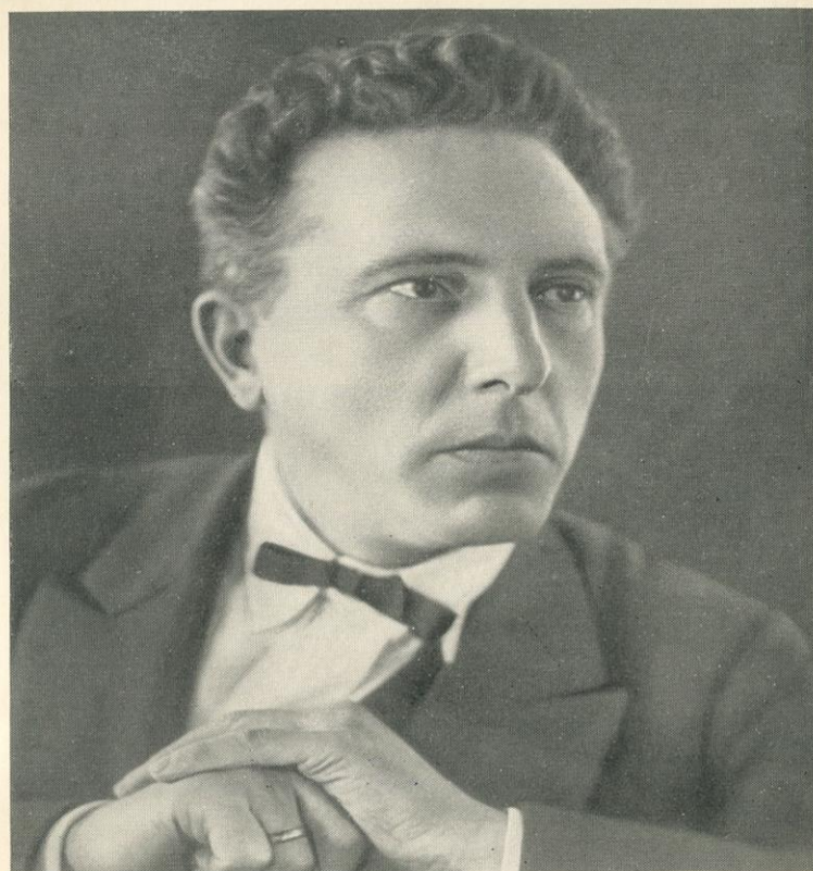
Протазанов Яков Александрович (1881-1945 гг.)