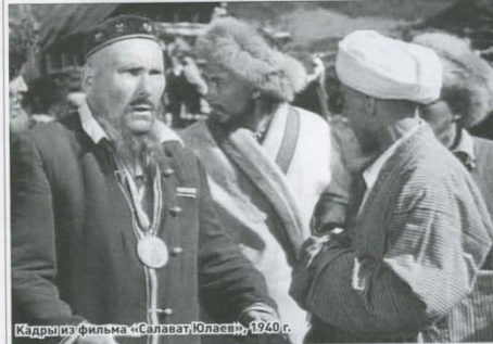
Кадр из фильма «Салават Юлаев», 1940 г.